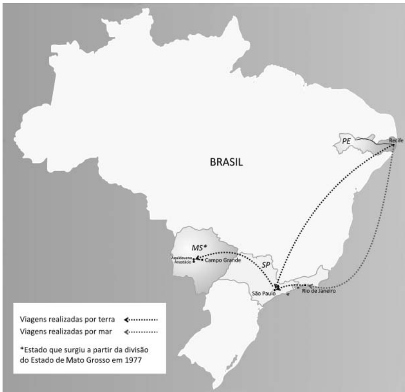
Mapa do deslocamento realizado pelos migrantes da Colônia do Pulador

São os "migrantes", residentes na Colônia do Pulador e no município de Anastácio, que se procura conhecer e estudar no momento. Sabe-se que esses homens e mulheres lutaram para conquistar e fazer progredir seus espaços nas terras mato-grossenses. Tais espaços foram construídos lentamente, cotidianamente, com entusiasmo, respeito, perseverança, com o auxílio da natureza, mas, também, com muito trabalho para domesticá-la e para aproveitar suas riquezas e forças.