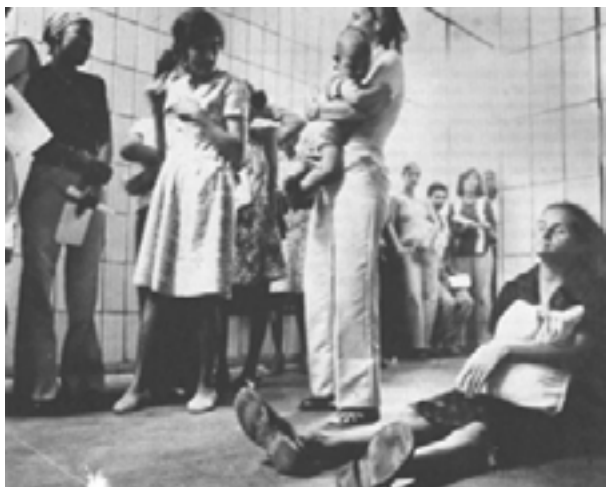
Figura 7. Mulheres e crianças em fila de espera, enfrentando as precárias condições dos serviços públicos de saúde nas grandes cidades brasileiras durante a década de 1970