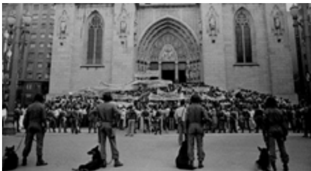
Figura 4. Manifestação popular na Praça da Sé, São Paulo (SP)

Nessa perspectiva, vamos encontrar, na ordem do dia, uma grande moção da massa popular, engajados na tentativa de alterar a relação entre o Estado autoritário, decorrente do Golpe de 1964 no país, a sociedade civil e as mobilizações populares.