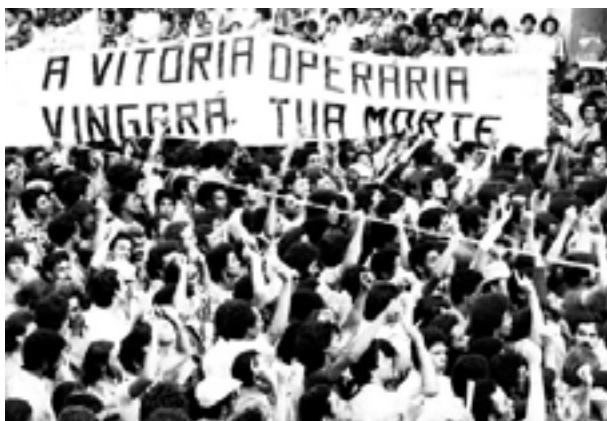
Figura 9. Manifestação contra a morte de Santo Dias na Praça da Sé