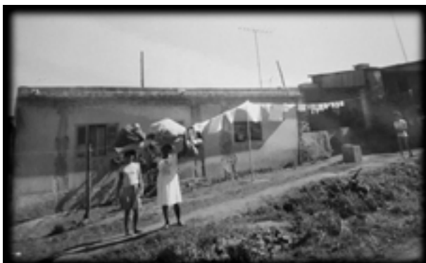
Figura 1. Moradores da Fazenda da Juta