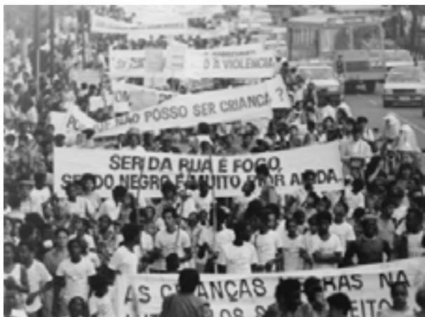
Figura 13. Manifestação pelos direitos da infância e da juventude nos anos 1980