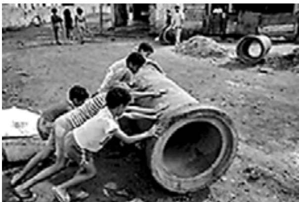
Figura 6. Crianças brincando na periferia de São Paulo (SP)