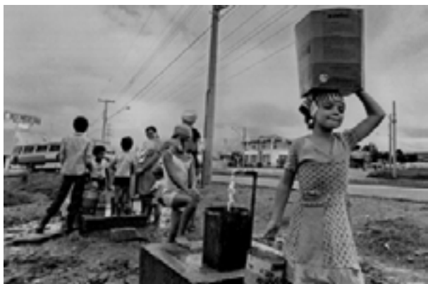
Figura 12. Abastecimento de água na favela, 1980

As fotografias de Juca Martins expõem a realidade das periferias: crianças brincando em meio à ausência de infraestrutura e famílias dependendo de caminhões-pipa para água. Tais condições, agravadas pela negligência estatal, justificavam as reivindicações por creches como espaços não apenas educativos, mas de sobrevivência. A imagem das crianças na favela Heliópolis ilustra como a falta de políticas públicas perpetua ciclos de pobreza, reforçando a urgência de equipamentos que integravam o cuidado e a educação.