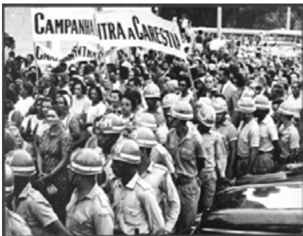
Figura 3. Manifestação popular contra a carestia realizada em 1978

O panfleto e a foto da Agência Estado retratam uma das maiores mobilizações populares da década de 1970, organizada pelo Movimento Custo de Vida (MCV). Em plena ditadura, cerca de 20 mil pessoas protestaram na Praça da Sé contra a inflação e o arrocho salarial. As imagens revelam a articulação subterrânea de movimentos sociais, muitas vezes liderados por mulheres, que vinculavam a luta econômica à demanda por creches. A carestia, agravada pelo “milagre econômico” excludente, reforçava a necessidade de equipamentos públicos para aliviar a carga das mães trabalhadoras.