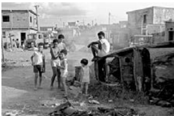
Figura 11. Crianças na Favela Heliópolis, na cidade de São Paulo, em 1980

Por aqueles dias, a exploração e a aviltante condição da classe trabalhadora não era suficiente para satisfazer a expectativa de lucro dos donos do capital, as duas fotografias de Juca Martins que reproduzimos a seguir, registram de maneira crua e sem retoques a condição de opressão à que estavam submetidas as crianças que viviam nas periferias das cidades brasileiras, traduzem com maestria que estávamos muito longe de alcançar a universalização da educação escolar, com a infância e a juventude abandonadas à própria sorte, desprovidas de quaisquer assistência cultural, vivendo em habitações lúgubres, localidades sem o abastecimento de água potável, a instalação de sistemas de captação e tratamento de esgotos, com o transporte público precário ou mesmo inexistente, sujeitos a criminalidade e a violência urbana, e os serviços de saúde pública mostrando-se como uma quimera em suas vidas.