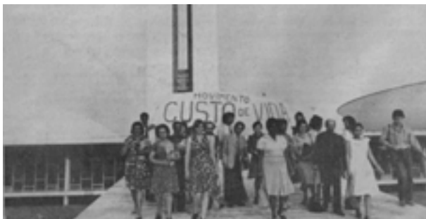
Figura 5. Comissão do Movimento Custo de Vida encarregada da entrega de abaixo-assinado em Brasília em 1978

Essa presença de novos atores na cena social e política caracterizou-se como um período de lutas e reivindicações no campo educacional brasileiro, mormente, na cidade de São Paulo, houve a ocorrência de significativas mobilizações e assinalou a vigência de inúmeros movimentos sociais na área da educação.