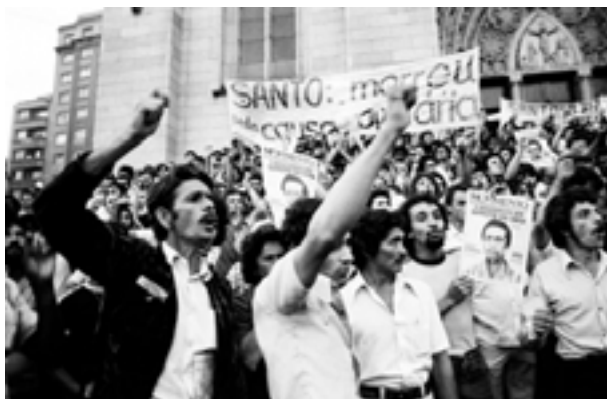
Figura 8. Manifestação contra a morte de Santo Dias, na Praça da Sé