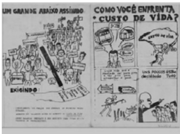
Figura 2. Panfleto do Movimento Custo de Vida

nos 20 mil pessoas para participar de um ato público em defesa da democracia, do direito de livre organização e a protestar contra as arbitrariedades governamentais.